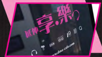
▶ 提供優質咖啡、飲品及食物