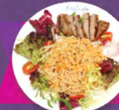
F. 秘製辣醬煎豬頸肉拌冷天使麵 CAPPELLINI WITH PORK JOWL IN CHILLI SAUCE

可選 $40 或以下之飲品一杯 / $40 以上之飲品補回差額 (手沖咖啡 / 冰滴咖啡除外)