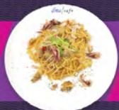
A. 白酒香蒜海鮮意粉 ASSORTED SEAFOOD WITH WHITE WINE AND GARLIC SAUCE