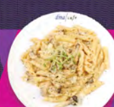
D. 白汁雜菌芝士長通粉 MIXED MUSHROOM PENNE WITH CREAMY SAUCE

可選 $40 或以下之飲品一杯 / $40 以上之飲品補回差額 (意大利雪糕咖啡 / 手沖咖啡 / 冰滴咖啡除外)