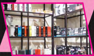
◀ 精選個人音樂產品空間