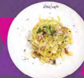
C. 煙肉蛋黃忌廉意粉 CARBONARA