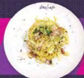
C. 煙肉蛋黃忌廉意粉 CARBONARA