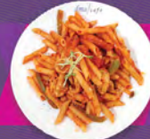
B. 拿破侖慕尼黑白腸長通粉 MUNICH WEISSWURST PENNE WITH NAPOLEON SAUCE