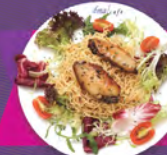
E. 雞翼芝麻醬拌天使冷面 CAPPELLINI WITH CHICKEN WINGS IN SESAME SAUCE