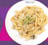
D. 白汁雜菌芝士長通粉 MIXED MUSHROOM PENNE WITH CREAMY SAUCE