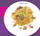
A. 白酒香蒜海鮮意粉 ASSORTED SEAFOOD WITH WHITE WINE AND GARLIC SAUCE