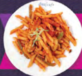
B. 拿破侖慕尼黑白腸長通粉 MUNICH WEISSWURST PENNE WITH NAPOLEON SAUCE